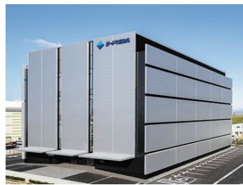
リサーチセンター

〒930-0912 富山県富山市日俣 77-3 リサーチセンター TEL (076) 413-3611 / FAX (076) 413-3613 (営業本部・海外事業部) TEL (076) 464-5710 / FAX (076) 464-5730 (営業本部・国内事業部) TEL (076) 424-2885 / FAX (076) 423-8652